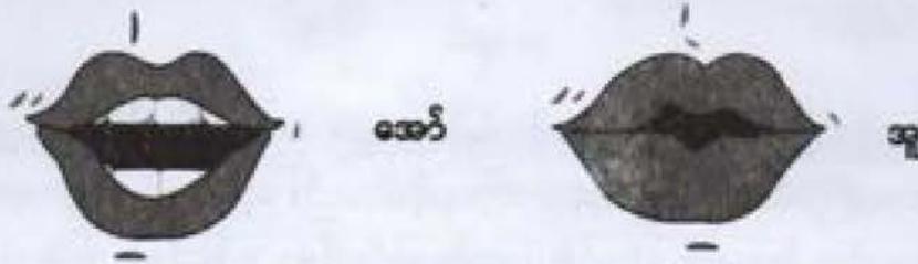
နှုတ်ခမ်းစိုင်းသရများ

အချို့သရများကို ရွတ်ဆိုသည့်အခါ လေသည် နှာခေါင်းမှထွက်သွားကာ နှာခေါင်းသံပါသွားသဖြင့် ယင်း သရတို့ကို 'နှာသံပါသရ'ဟု ခေါ်ပါသည်။ 'နှာသံပါသရ' ခုနစ်သံ ရှိသည်။ ယင်းတို့မှာ 'အင်၊ အန်၊ အွန်၊ အိန်၊ အုန်၊ အိုင်း၊ အောင်'တို့ ဖြစ်ပါသည်။